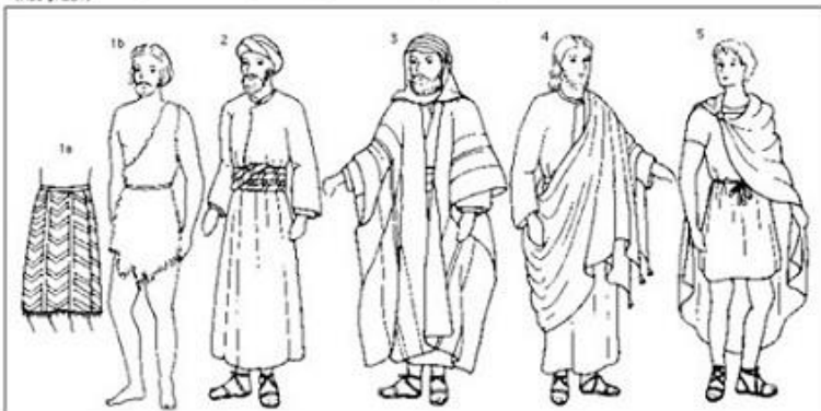
Ancient Styles of Dress: 1a. One type of linen cloth (Semitic, ca. 1000 B.C.); 1b. Animal skin; 2. Men's tunic or coat; 3. Men's mantle; 4. Himation; 5. First-century cloak or cape. (HBD p. 227)

Dis juis met hierdie jas wat al die moeilikheid begin het. Dis 'n baie besondere jas wat Jakob vir sy gunstelingseun gegee het. Nie omdat dit so bont was, soos ons aanvanklik gedink het nie, maar omdat dit 'n baie luukse jas was. Oor eeue was daar al baie gespekuleer oor die JAS, soveel so dat daar gese word dat dit 'n kleurvolle JAS was, daar is self predikers wat spesifieke betekenis aan sekere kleure van die jas gee. Hoe dit ook al sy, al wat die Bybel vir ons sê is dat dit 'n baie spesiale jas was en dat dit die broers jaloers gemaak het en vir Josef, kan ons maar sê so bietjie arrogant en windmakerig. Josef se dromery en stories-aandraery het ook nie juis gehelp nie. 'n Mens kry die gevoel Josef was 'n bra arrogante mannetjie. En die laaste strooi is dalk as hy sy broers in die veld gaan opsoek met sy koninklike gewaad aan.